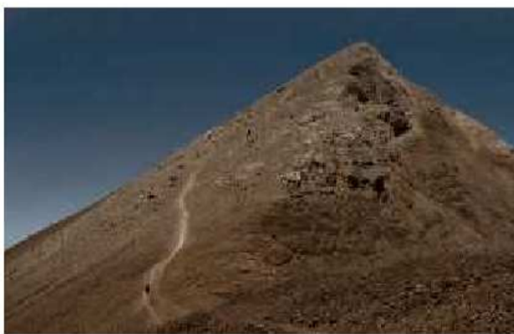
Zweitageswanderung: Gipfel des Uri Rotstock

Nach dem reizvollen Präludium in Isenthal angekommen, müssen wir uns entscheiden. Zwei Wege