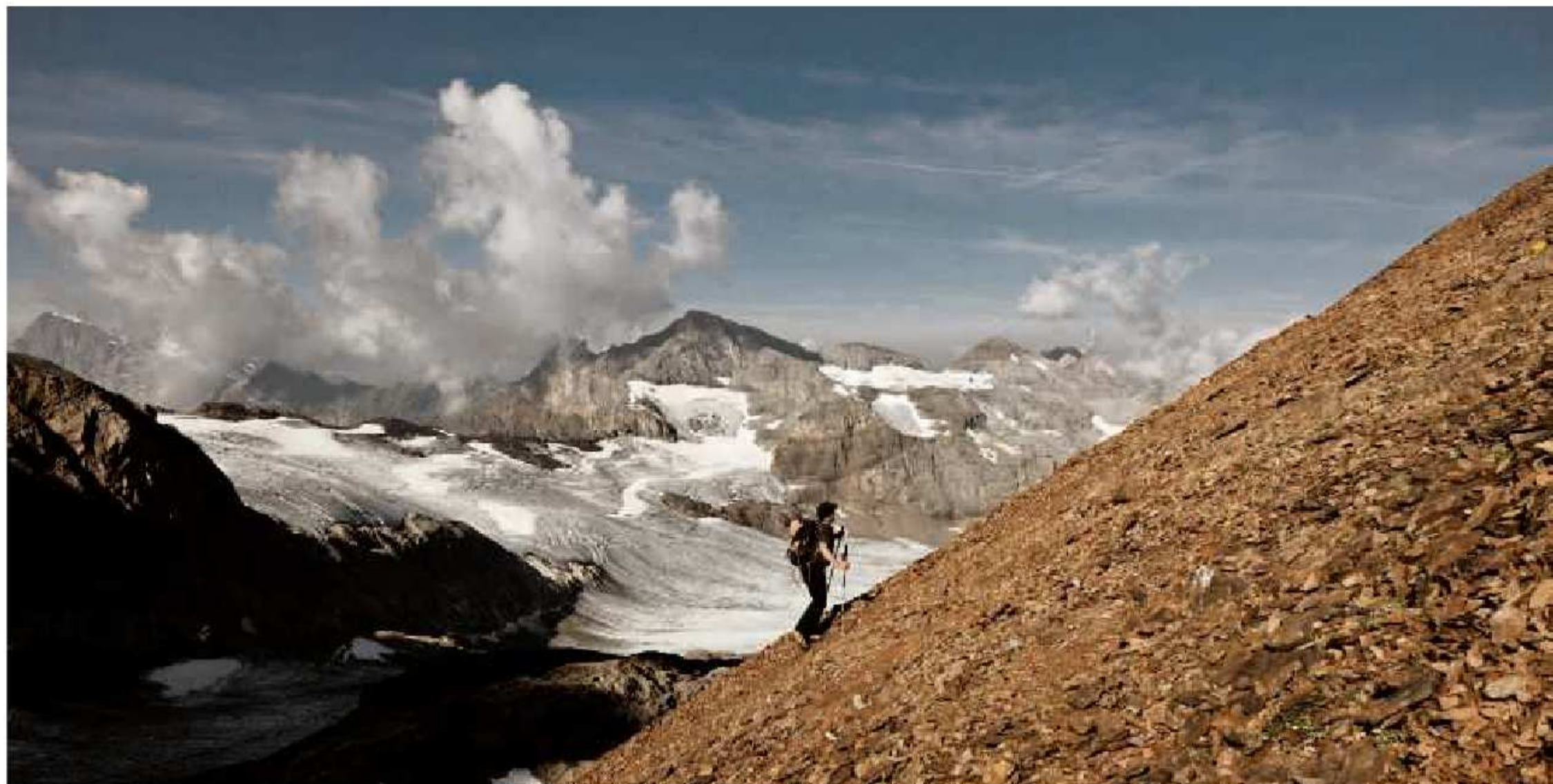
Das Panorama ist ein Gedicht: Aufstieg auf den Uri Rotstock mit Blick auf den Blüemlisalp und den Wissigstock (Mitte)